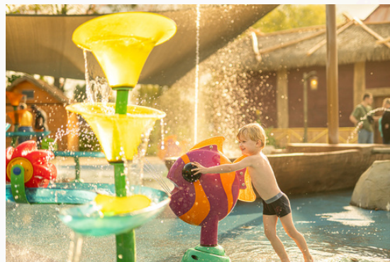
Zone Exotic Island

La biodiversité , avec l'installation de nichoirs à oiseaux et d'hôtels à insectes pour encourager la présence d'espèces locales, de pollinisateurs et d'insectes auxiliaires. Ces dispositifs complètent une démarche plus large intégrant la politique zéro phyto, les ruches, le recensement des espèces présentes sur les espaces verts et la prise en compte de la biodiversité dans les choix d'aménagement et d'entretien.