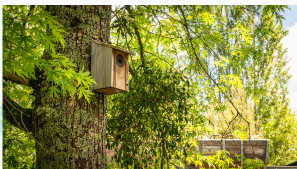
Nichoir à oiseaux