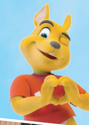
Le Petit Vapeur

Pour des raisons de sécurité, une seule personne ayant un handicap est autorisée à embarquer par cycle de l'attraction.